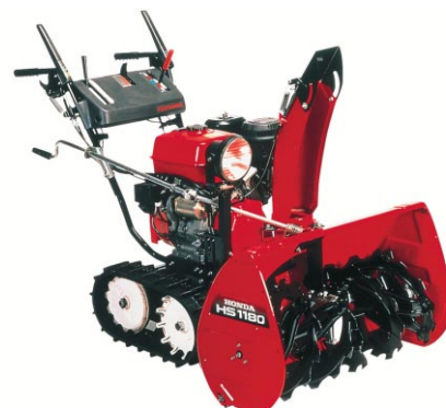
Model HS 1180TS