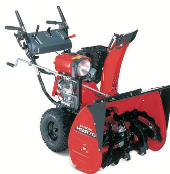
Model HS 970W

precyzyjnie dopasowana moc silnika oraz technika podnoszenia zabieraka, umożliwia bardzo wydajne odśnieżanie nawet po obfitych opadach śniegu