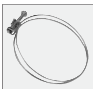
opaski zaciskowe 3 szt.