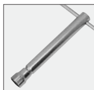
klucz do świecy