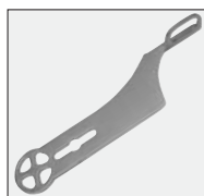
klucz do korpusu