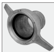
nasady 2 szt.

W komplecie wraz z każdą motopompą otrzymają Państwo: