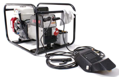
EP200X1 / (FULLOP)