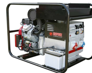
EP250XE / 300XE